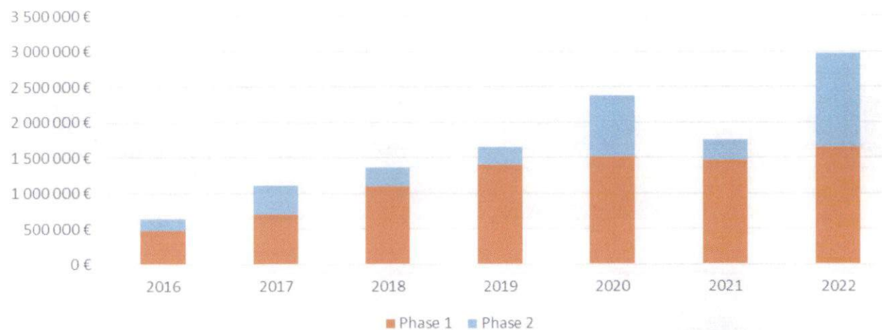
TOTAL DES OPERATIONS